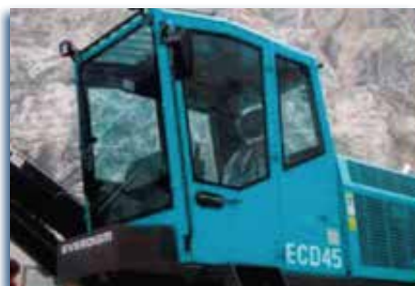
Cabina certificada Rops y Fops.