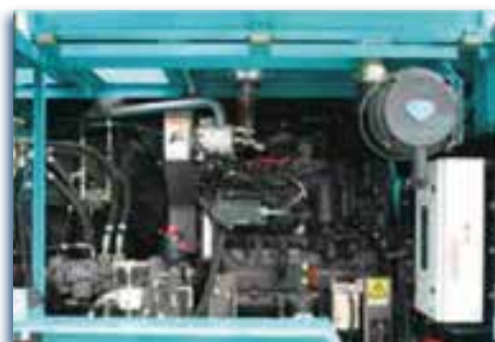
Ancha y fácil para trabajar.