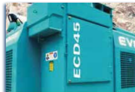
Eficiente y fuerte colector de polvos con seis cartuchos.