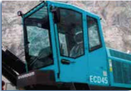
Cabina certificada Rops y Fops.