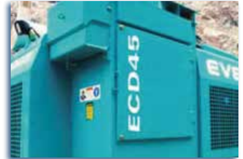
Eficiente y fuerte colector de polvos con seis cartuchos.