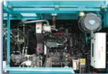
Ancha y fácil para trabajar.