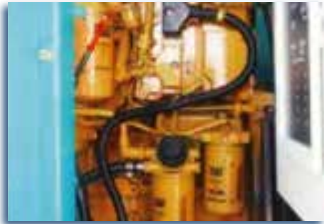
Motor disponible en Cat y Cummins.